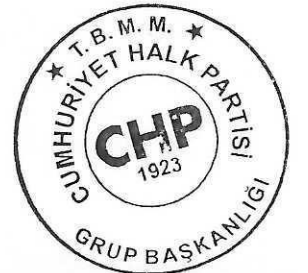
Doç. Dr. Gökhan Günaydın İstanbul Milletvekili CHP Grup Başkanvekili